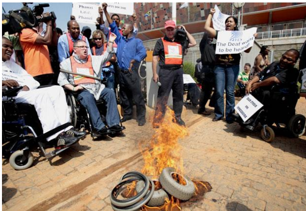
Les handicapés protestent à l'extérieur de l'Association Sud Africaine de Football le 25 mars 2010.

Au moment où la fièvre du football prend d'assaut tout le continent,