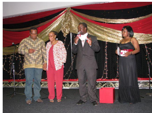
Owen Nxumalo, Maire du Conseil Municipal de Manzini conduisant une session de promesse pendant qu'un couple fait une promesse.

Pendant la campagne, les 145 couples présents ont été encouragés à faire des promesses, signer et échanger les cartes de promesses qui portaient le message "A cause de mon amour pour toi, je promets de te protéger contre le VIH". Les cartes étaient accompagnées des préservatifs d'amour offerts par la Fondation Soins de Santé SIDA et des tasses d'amour munies de messages de promesses.